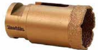
MKD-61070 BROCA DIAMANTE AMOLADORA 6 MM 22'65 €