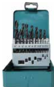
MKD-29941 JUEGO BROCAS METAL HSS-G METAL (19PCS) 39'64 €